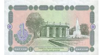
紙幣に描かれている日本人が建設に関わったナヴォイ劇場

「海外引揚がつないだご縁」を東京オリンピック・パラリンピックにつなげようと「ホストタウン」に登録されました。